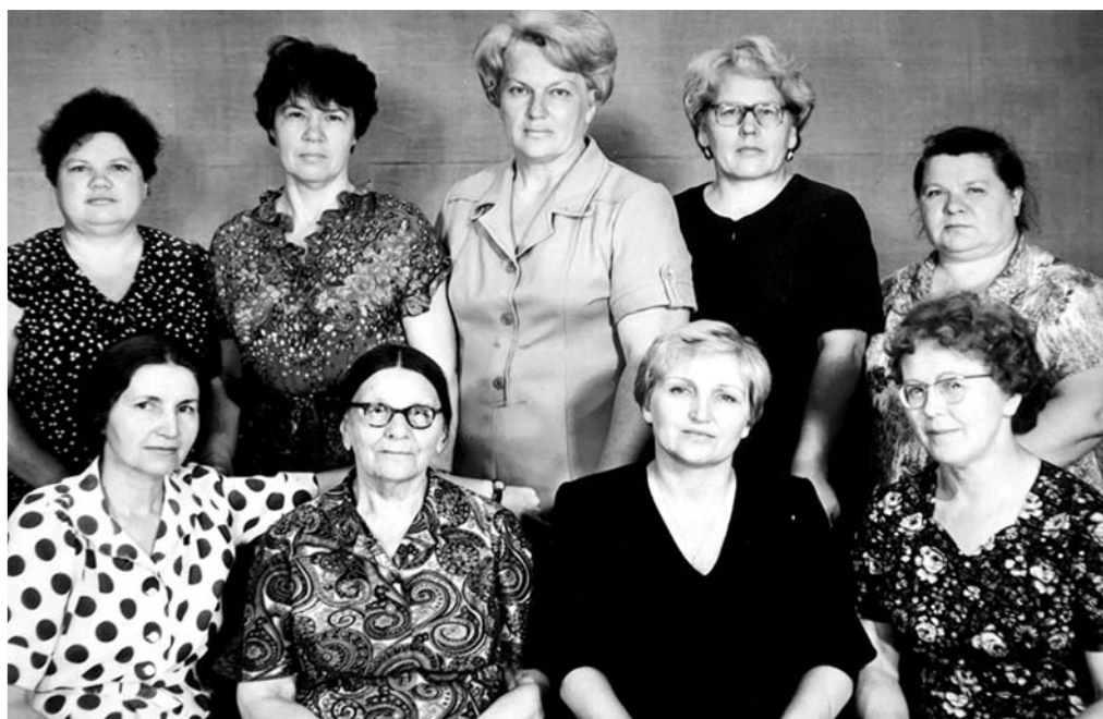
Педагогический коллектив 181-й школы