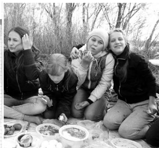
И учеба, и отдых...