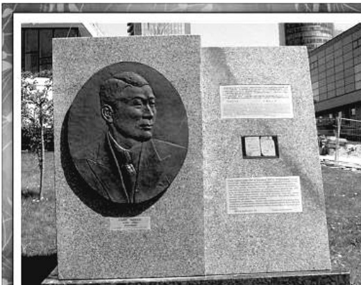
Памятник Тиуне Сугихаре в Вильнюсе

решающий вопрос: почему он делал это? Сугихара прежде никогда не имел каких-либо контактов с евреями. Почему тогда он рисковал своей карьерой и, возможно, своей жизнью, чтобы спасти жизнь этих беженцев?