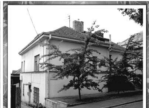
Музей Сугихары в Каунасе

немного известно о плане Японии переселить до миллиона европейских еврейских беженцев в марионеточное государство Маньчжоу-го. Теперь «план Фугу» широко признан как