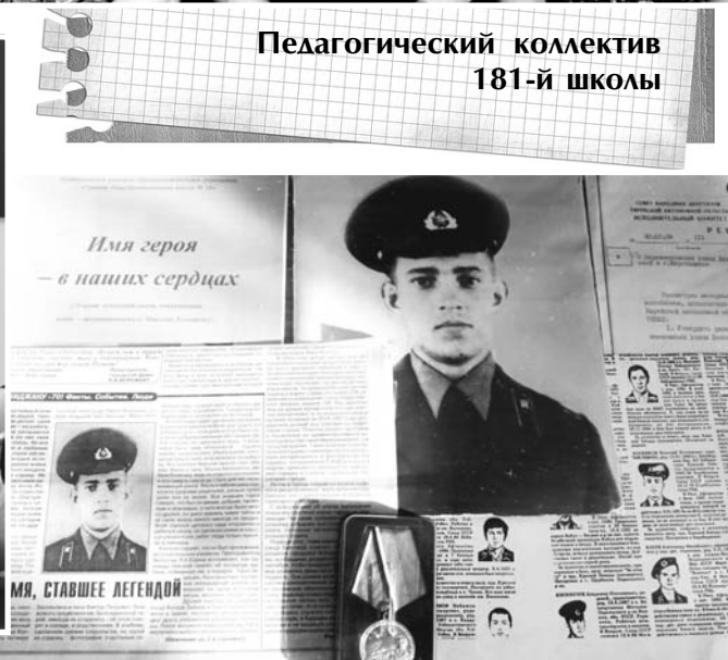
Экспозиция школьного музея, посвященная Николаю Косникову