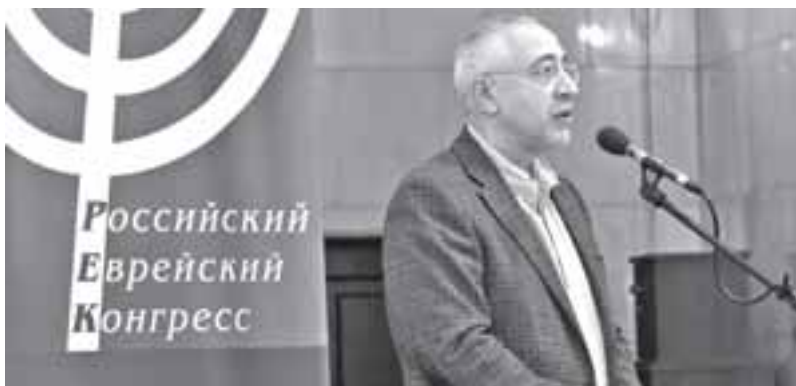
Выступает Николай Сванидзе

стран. Их усилиями удалось привлечь внимание общественности к подвигу бойцов Собибора, — говорится в обращении Юлия Эдельштейна.