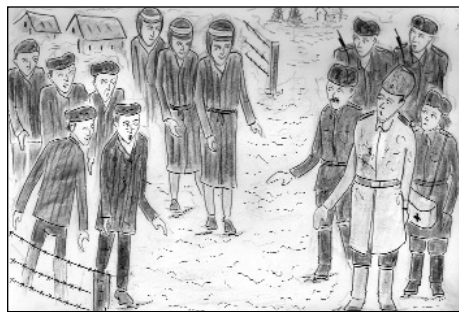
"Освобождение". Рисунок Бориса Есельсона

еврейского населения нацистами и освобождения уцелевших в концлагерях Красной армией, интересовались судьбой автора, юношей трудившимся в Средней Азии на военных заводах, работавших на Победу.