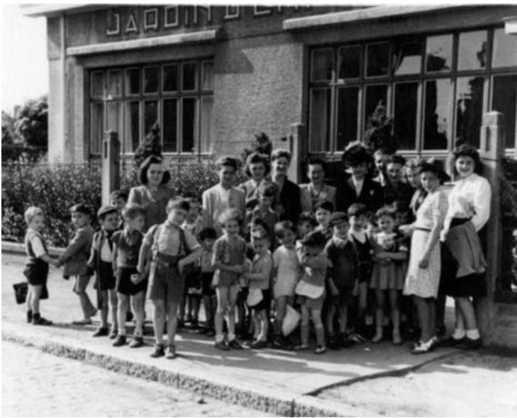
Групповой портрет, на пиджаке одной из воспитательниц — звезда Давида

И вот теперь в качестве директора еврейского детского сада в еврейском квартале Брюсселя ей пришлось не только наблюдать жизнь своих подопечных, но и участвовать в ней — и в самое неподходящее время: дискриминация, изоляция, массовые аресты — всему этому она стала свидетельницей. И это навсегда изменило ее жизнь. Летом 1942-го нацисты принялись депортировать бельгийских евреев в концлагерь. Ребенок не приходит в садик, директор звонит ему домой, а оказывается, что всю семью арестовали — и так чуть ли ни каждый день. Другие дети приходят, осиротев за ночь, — депортировали родителей. Родители, знавшие или подозревавшие о грозившем