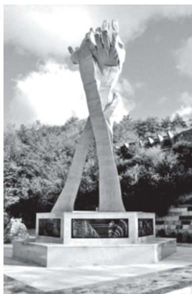
Памятник жертвам Холокоста в Янтарном

В рамках конференции пройдет ежегодный семинар для педагогов еврейских школ из России, СНГ и стран Балтии. Он посвящен проблемам сохранения исторической памяти о Холокосте: преподавание; поиск имён жертв и спасителей; проведение мемориальных мероприятий. Участники посетят памятные места Холокоста в Калининграде и мемориал в пос. Янтарном. Соорганизаторы конференции: Научно-просветительский Центр «Холокост», Балтийский федеральный университет имени И. Канта, Институт Всеобщей истории РАН, Институт Российской истории РАН, Российский государственный гуманитарный университет, (Россия), Институт современной истории (Мюн-