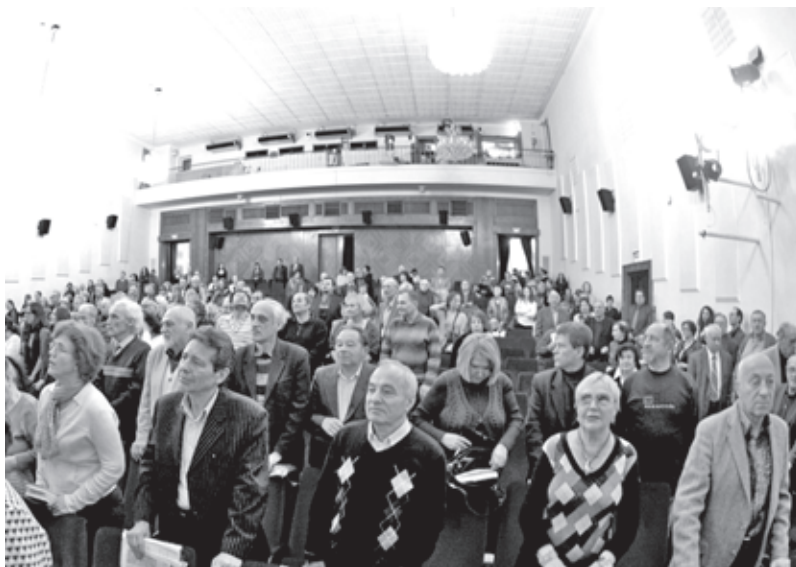
Участники вечера в ЦДЛ

Додике). Герой фильма присутствовал на вечере. На нем также выступили президент Российского еврейского конгресса Юрий Каннер, главный раввин России Берл Лазар, научный руководитель Высшей школы экономики Евгений Ясин, послы Германии и США Ульрих Бранденбург и Майкл Макфол.