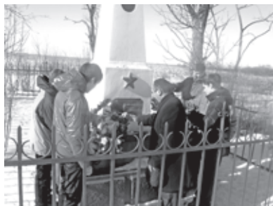
Возложение цветов у памятника в Минводах

Особенно значимыми нам представляются посещения в эти дни мест захоронений и памятников жертвам нацизма.