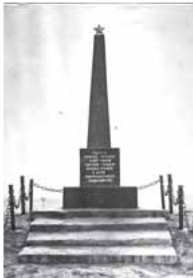
Памятник жертвам фашизма. Рославль

Ошибки (неточности), встречающиеся у Ивановой при написании географических названий, имен и фамилий исправлены без оговорок (за исключением специально оговоренных случаев). Датировка текста и уточнения даны составителями в квадратных скобках. При передаче текста документа сохранен стиль подлинника. Приложения расположены в хронологическом порядке.