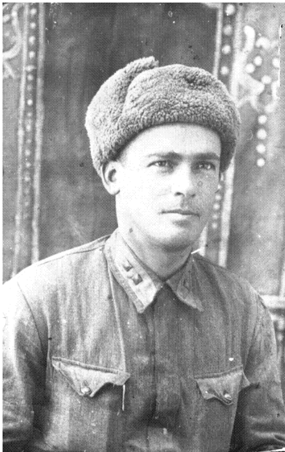
1943г. Последнее фото с фронта