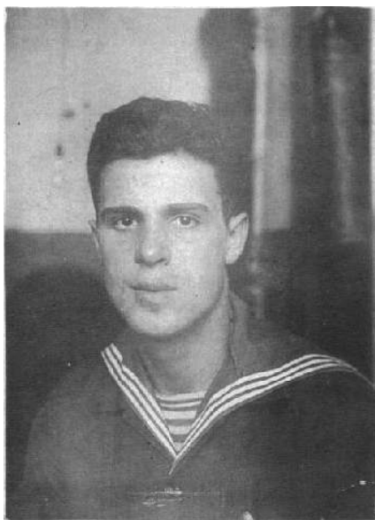
Служба в Хабаровске в 1935году.